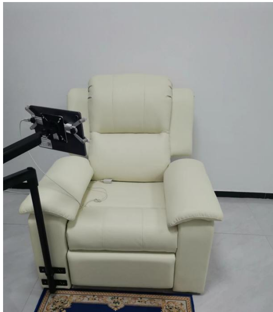
智能反馈运动系统体验